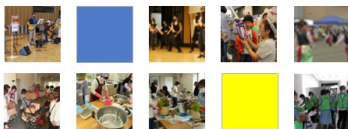
メーロプラザの6割のイベントは、市民や団体が参加する実行委員会や協働により運営されています。